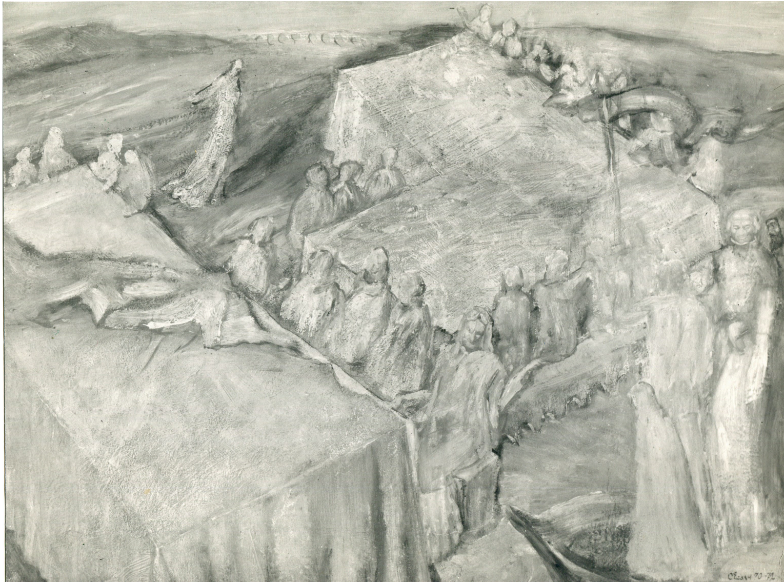
Personnages attablés (hommage à Magnasco), Acrylique sur agglo, 70 x 120 cm, Moscou, 1970-72